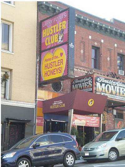
The Hustler Club in San Francisco

Larry Flint (1942) bouwt in de Verenigde Staten een gelijkwaardige loopbaan op. Ook hij start, na een periode van allerlei banen, een striptent. Zijn clubs zijn een groot succes, want je kunt er meer dan alleen maar naar de dames kijken... Flint bezit al snel een hele keten stripclubs. Hij neemt zelf de audities af en duikt bijna dagelijks met zijn danseressen in bed, liefst drie tegelijk. Hij richt de Larry Flint Publications op en start het pornoblad Hustler (1974). Dit was een van de eerste grote mannentijdschriften. Het pornoblad ontwikkelde zich vanuit de goedkope advertentiebladen van zijn stripclubs ( Hustler Newsletter ). Hustler doorbrak een taboe waar andere seksbladen (zoals Playboy ) zich tot op dat moment strikt aan hadden gehouden: het expliciet tonen van het vrouwelijk geslachtsorgaan. Dit waren de zogenaamde 'pink-shots'. Het bleek een gouden zet midden in de eerste grote economische crisis (oliecrisis van 1973). Flint stortte zich met zijn uitgeverij ook op de videomarkt. Hij voegde filmzalen aan zijn striptenten toe.