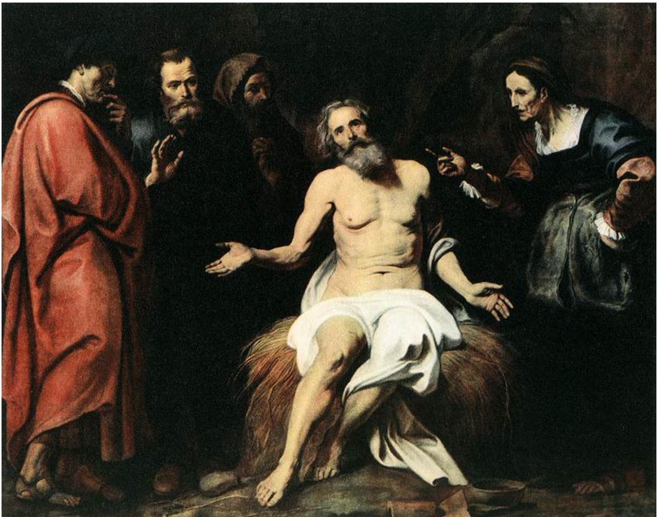
Gerard Seghers, De geduldige Job (1620)

Hier raken we de kern van het vijfde deel van de Herakles marathon. Herakles stelt vragen naar de zin van het lijden en ontdekt tot zijn verrassing dat hij is voorbestemd tot onsterfelijkheid. Vragen die de paradox van het mens-zijn, waarover elke religie zich buigt, centraal stellen. Het kenmerkt de fundamentele religiositeit van de mens dat hij zijn plaats in het bestaan een betekenis wil geven en zich op een of andere manier wil verbinden met een tijd die na hem komt. Katalysator van deze vragen is de ontmoeting van Herakles met Prometheus. Prometheus is geen mens, geen halfgod zoals Herakles, en ook geen Olympische god. Prometheus is een Titaan. Titaan betekent zoiets als 'heerser' of 'edele heer'. De namen van de Titanen verwijzen naar natuurkrachten of naar kwaliteiten. Prometheus betekent 'hij die vooruit ziet'.