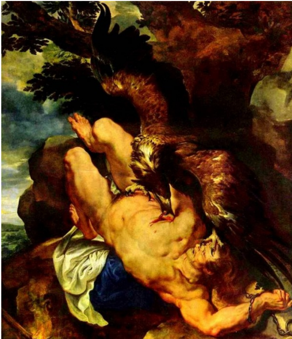
Pieter Paul Rubens, Prometheus geketend (1611/1612)

niet wou toegeven dat Prometheus hem keer op keer te slim af was geweest en dat hij nu zo wraakzuchtig had gereageerd, verzong een leugen: hij zei dat Prometheus een heimelijke liefdesaffaire had met Athena.