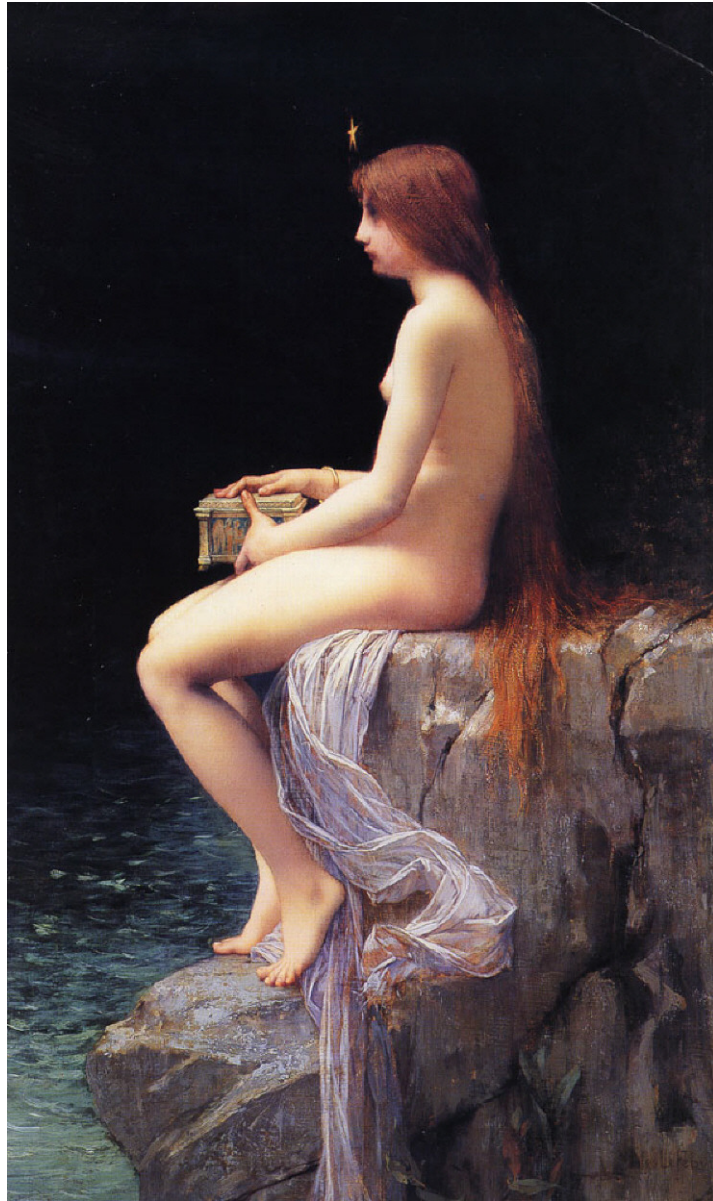
Jules Joseph Lefebvre, Pandora (1882)

te komen, maar om onwaarschijnlijk te zijn en haar gevoelens te verbergen.” 36 Epimetheus leidde zijn prachtige vrouw rond in zijn huis en gaf haar alles wat hij had. Alles behalve één ding; de kruik van zijn broer. Daar moest ze af blijven. “Zeus heeft voorzien wat er zou gebeuren. Dat Pandora, zodra ze een keer alleen in huis was, het deksel van dat ene vat zou tillen om er eventjes in te gluren.” 37 Uit dat vat ontsnapten toen alle plagen die de mensen kunnen kwelen: Ziekte, Ouderdom, Krankzinnigheid, Zware Arbeid, Hartstocht, Verslaving, enz... 38