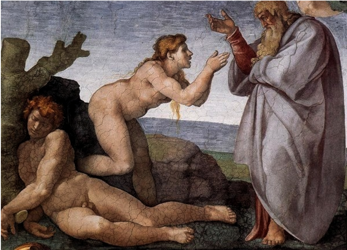
Michelangelo Buonarroti, De schepping van Eva (1508)

voortplanten; “en Adam bekende Eva, zijn huisvrouw, en zij werd zwanger, en baarde Kaïn.” (Genesis 4:1). Oude Joodse geschriften spreken van een andere vrouw van Adam: Lilith. God had haar net als Adam ook van klei gemaakt. “En ze eiste dezelfde rechten op die Adam had en wilde een gelijk deel hebben van het genot dat het liefdesspel hun beiden gaf. Dat maakte Adam woedend.” 75 Nadat Adam zich beklaagd had bij God, verbande God Lilith en maakte uit Adams rib een tweede vrouw; “een die mooi was en dom en kwebbelziek.” 76