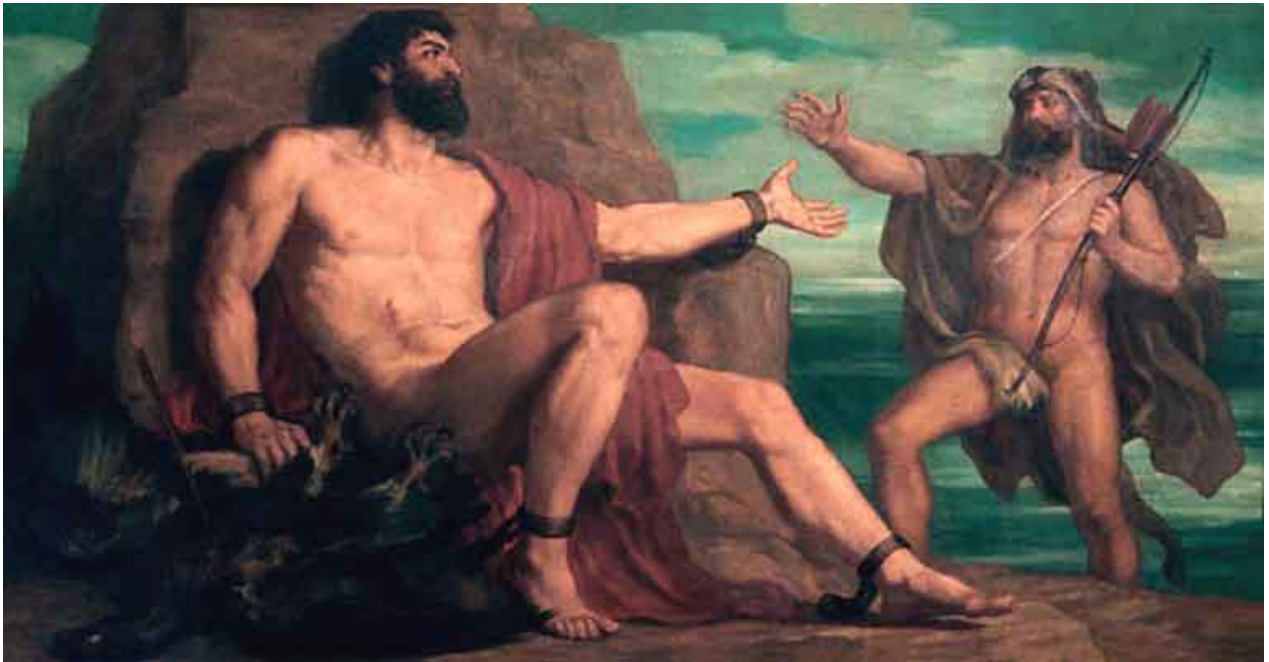
Christian Griepenkerl, Herakles bevrijdt Prometheus (eind 19 e eeuw)

Om deze inwijding te mogen ondergaan moet hij eerst burger worden van Athena. Dit betekent dat Herakles geen 'barbaar' meer is, geen vreemdeling, maar zijn burgerrechten, die hij na de moord op zijn kinderen verloor, terugkrijgt. Hij is klaar voor zijn reis naar de Onderwereld. 77