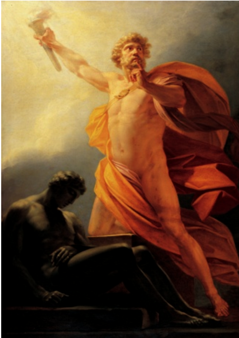
Heinrich Friedrich Füger, Prometheus rooft het vuur van de goden (1817)

wat 'die alles geeft' betekent. "Ze was de mooiste vrouw die er ooit had geleefd." 33 Zeus zond Pandora onder begeleiding van Hermes als geschenk naar Epimetheus, de broer van Prometheus.