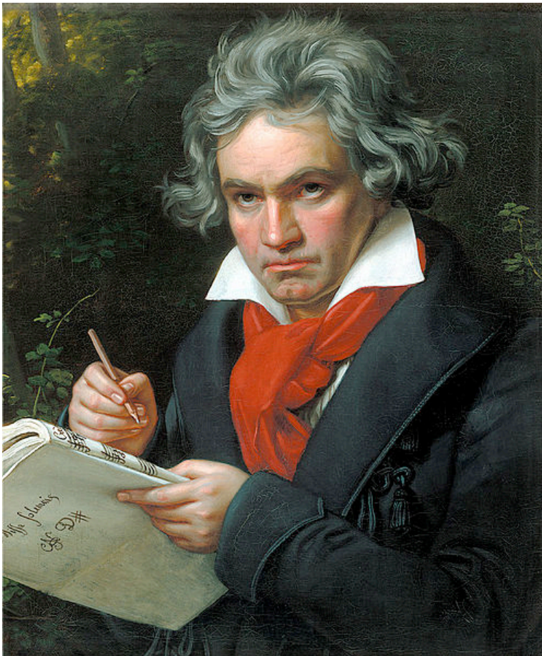
Ludwig van Beethoven (Joseph Karl Stieler, 1820)

schitteren als heldere sterren boven de Europese hemel.