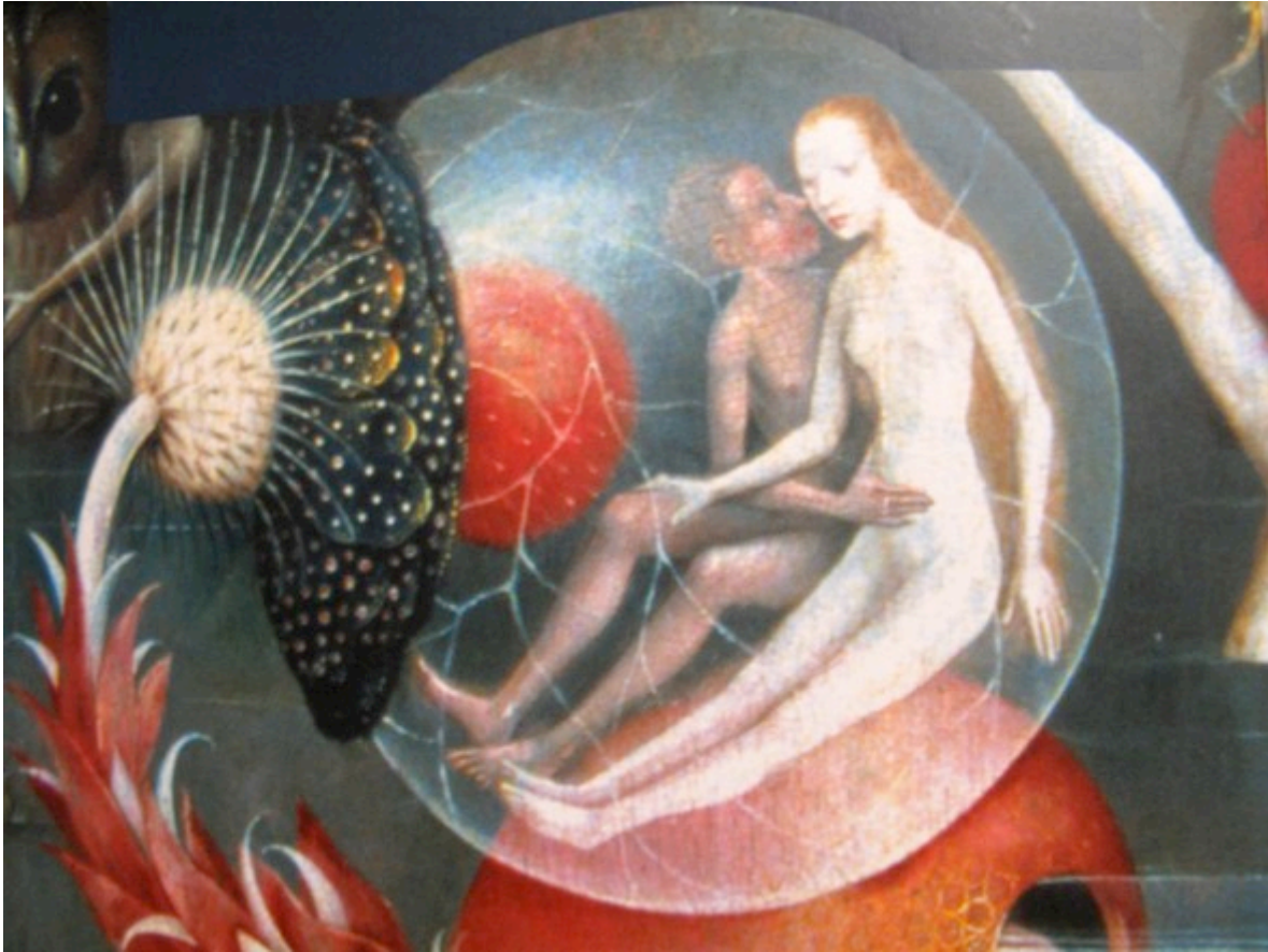
Jeroen Bosch, Tuin der lusten (ca 1500)