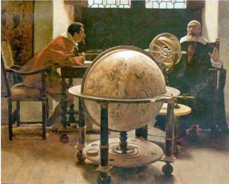
Tito Lessi, Galileo and Viviani (1892)