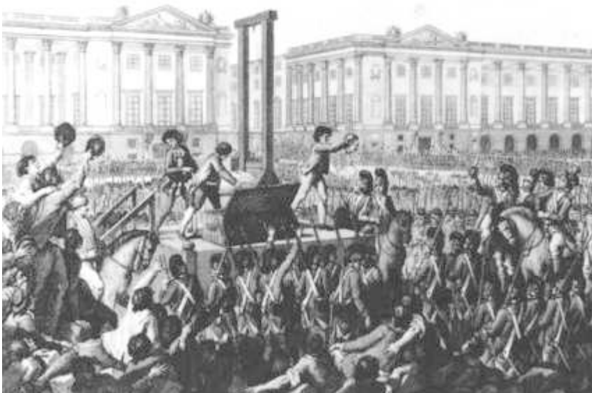
Franse Revolutie, 1789