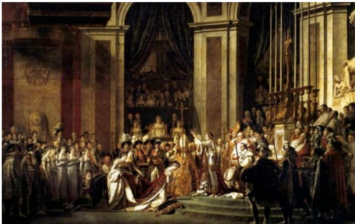
David - De kroning van Napoleon 2 (1807)

Toen Napoleon zichzelf tot keizer kroonde - hij deed dit letterlijk; hij nam de kroon uit de handen van de Paus om hem vervolgens zelf op z'n hoofd te zetten! - Was de vrije mens geboren Los van God.