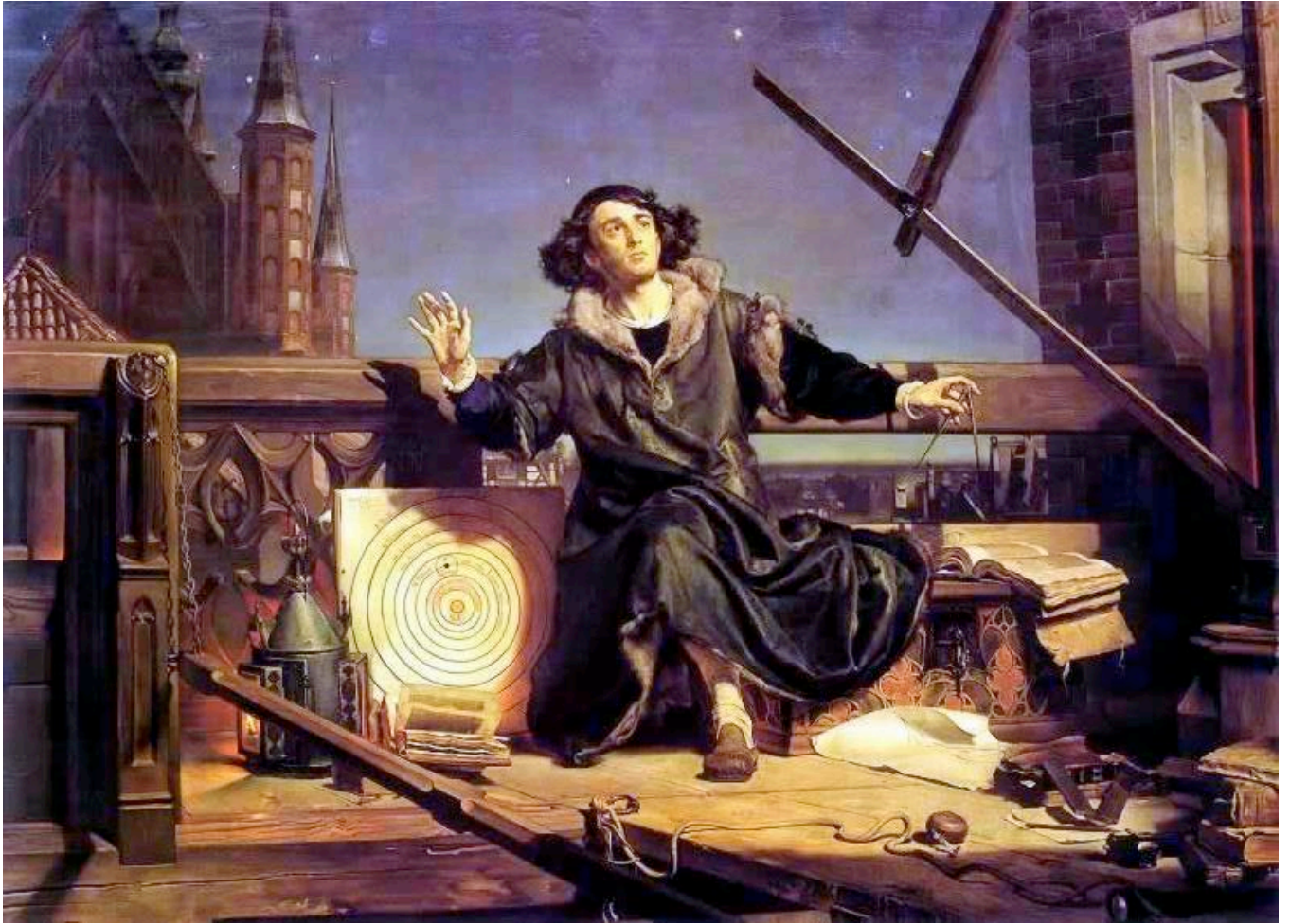
Jan Matejko – Copernicus (1874)