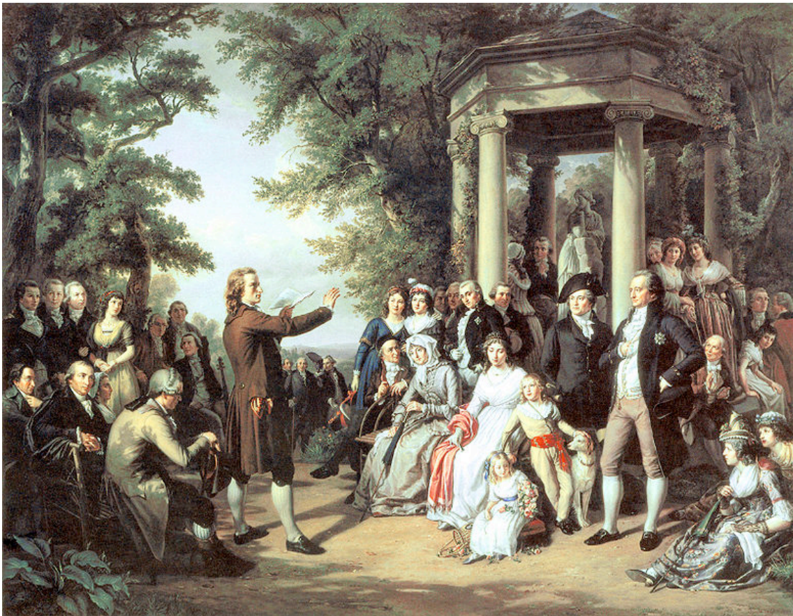
Theobald von Oer, Schiller leest voor (1860)

Luister naar de opening van de Negende Symfonie 4 Beethoven gooit er niet alleen de traditionele compositieregels overhoop, waarmee hij radicaal breekt met de traditie, hij schrijft met zijn Negende over het ontwaken van een nieuwe vrije mens. Los van God. Los van aristocratisch knechtschap. Een ode aan de broederschap tussen alle mensen. Schiller schrijft hiervoor het gedicht 'alle Menschen werden brüder' 5