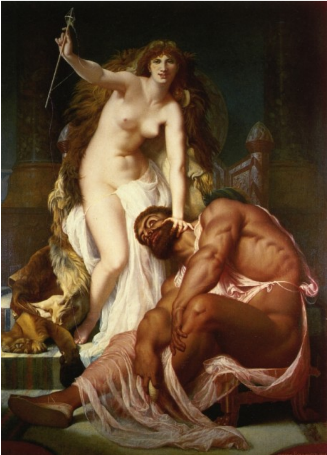
Gustave Boulanger, Herakles aan de voeten van Omphale (1861)

Ook bij Gustave Boulanger (1824-1888) overheerst de onderdanigheid van Herakles en de vernederende houding van Omphale. Herakles draagt een vrouwenkleed dat door zijn imposante lijf in flarden is gescheurd. Omphale torent boven hem uit; ze drukt hem letterlijk naar de grond. Hij laat het begaan, zij draagt zijn leeuwenhuid. De titel laat er geen twijfel over bestaan: Herakles aan de voeten van Omphale , als een getemde wolf.