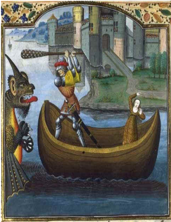
Herakles bevrijdt Hesione van het zeemonster, Middeleeuwse miniatuur

slaaf verkocht werd. 'Daarom werd Podarkes te koop aangeboden, en Hesione kocht hem vrij.' 39 Vanaf dat moment werd Podarkes Priamos genoemd wat 'vrijgekocht' betekent. Hij werd de nieuwe koning van het platgebrande Troje. Hesione werd de bijslaap van Telamon en baarde hem Teukros.