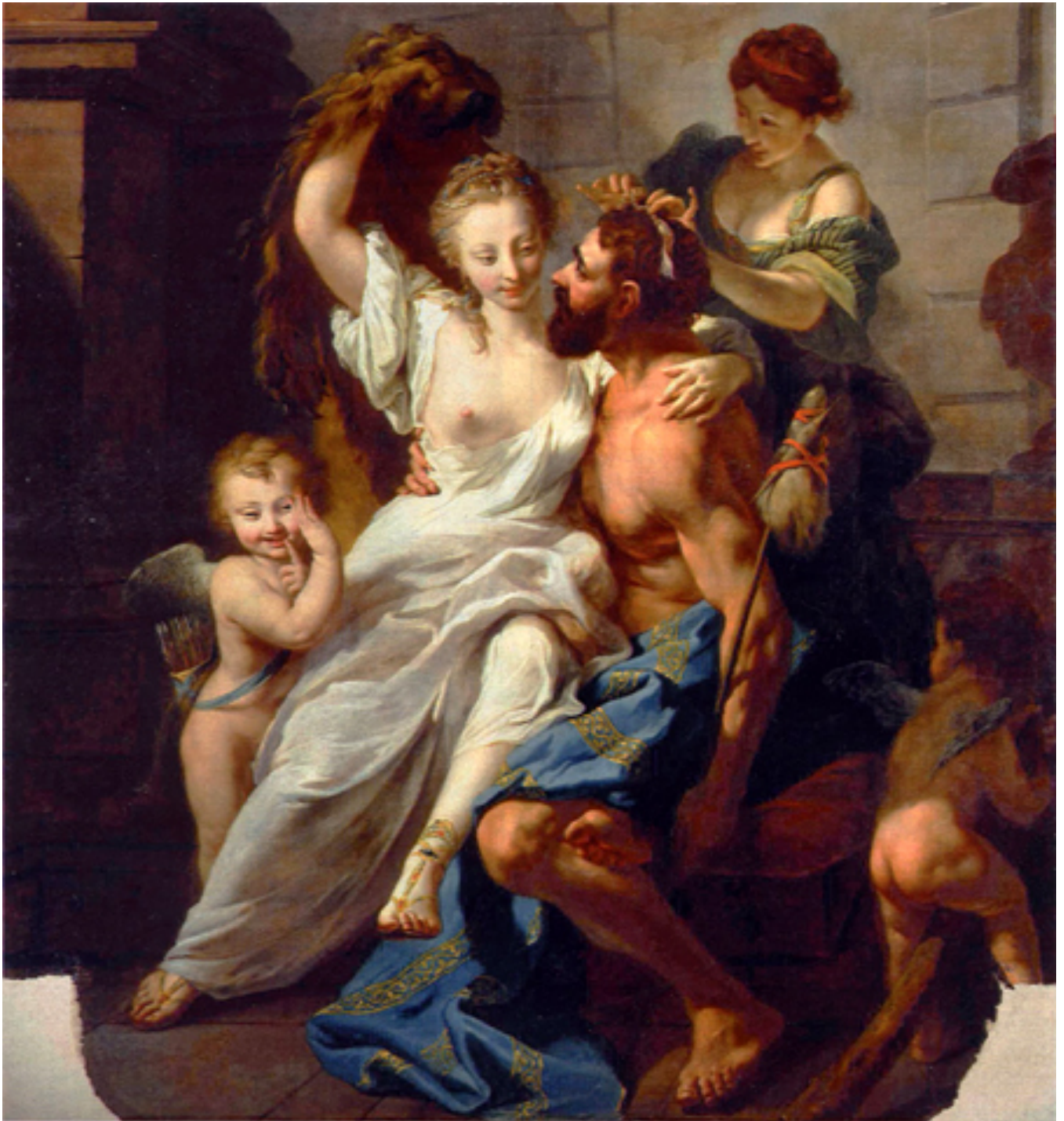
Johann Heinrich Tischbein, Herakles en Omphale (1754)

Bij François le Moyne (1688-1737) overheerst verliefdheid in het schilderij; het koppel kijkt elkaar diep in de ogen. Omphale houdt de knuppel van Herakles, waarvan de vorm weinig aan de fantasie overlaat, achter zich, tegen haar kont. Hij houdt haar spinrok en haar spintol in zijn handen. Amor staat glimlachend aan zijn zijde en biedt hen een schaalje vruchten aan.