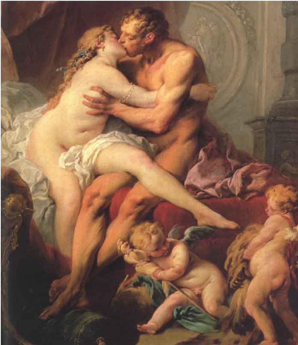
François Boucher, Herakles en Omphale (1735)

De montage van deze schilderijen toont hoe Herakles zich eerst in extase voor Omphale's schoonheid liet overmeesteren (Cranach - Spranger - Boulanger), hoe ze speels verliefd werden (Tischbein), hoe de liefde open bloeit (le Moyne) en er uiteindelijk passioneel gevreeën werd (Boucher). Het afleggen en uitwisselen van de maskers van het ego, de leeuwenhuid en de knots van hem ofwel de Griekse held. De kleren en juwelen van haar, de koningin, spelen in het toelaten en aanvaarden van de liefde een belangrijke rol. Eerder dan een perverse gewoonte, is het wisselen van kleren een teken van liefde tussen het koppel. Het vertrouwen tussen deze man en vrouw is zo groot dat zij elkaars persoonlijke maskers van hun ego kunnen en mogen dragen. Een maskerade van de sekse is eerder een uitdrukking van de wederkerigheid van hun liefde, dan van de perverse (zelf-)vernedering van Herakles. Het gaat immers om een uitwisseling en niet om het in bezit nemen van de symbolen van hun ego. Mocht dit laatste wel het geval zijn dan komen we in een ander universum terecht; het universum van de macht, uitgeoefend in een sado masochistische