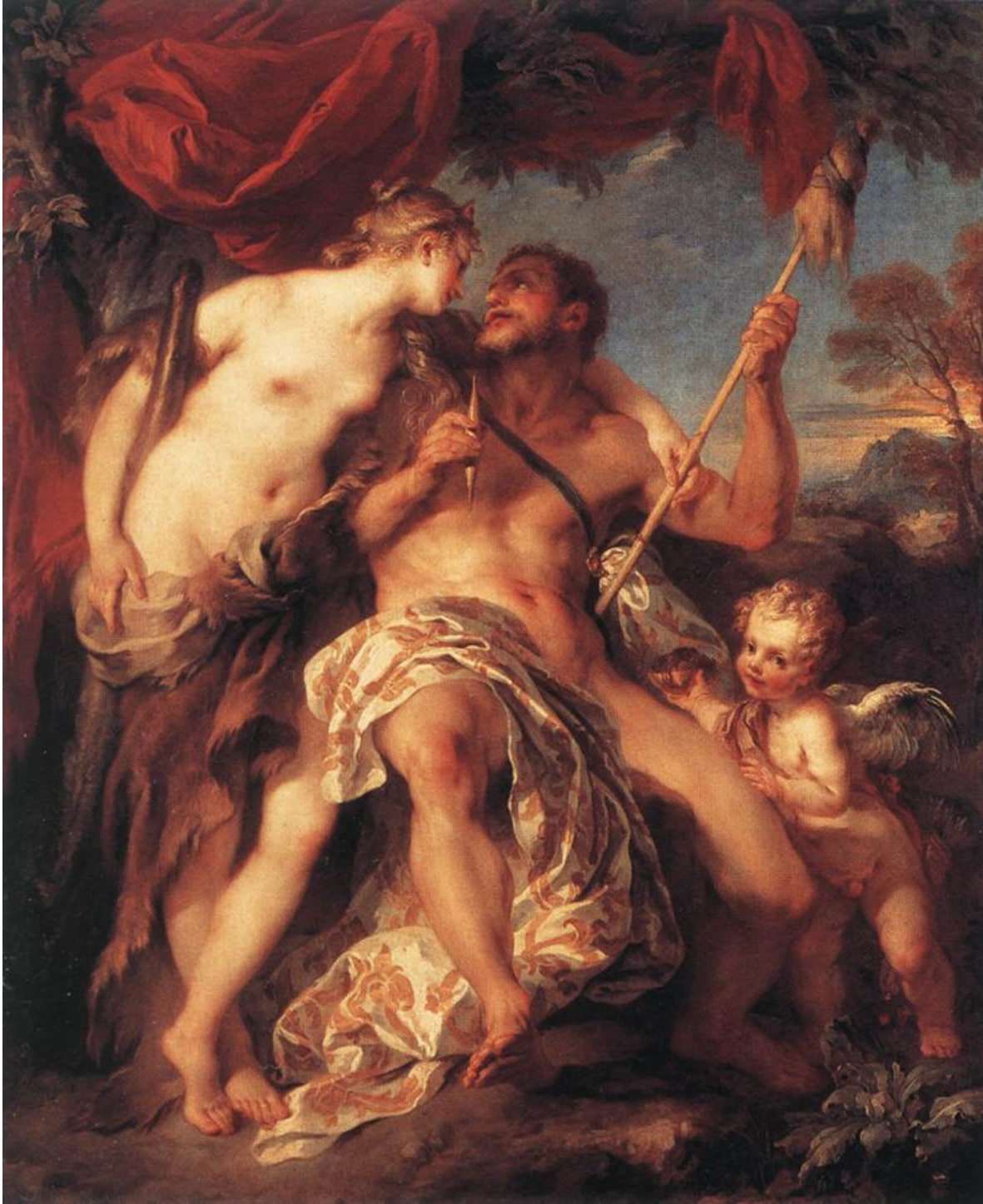
François le Moyne, Herakles en Omphale (1724)

Als laatste het schilderij van François Boucher (1703-1770). Hij laat het koppel zien in een passionele omhelzing; ze kussen elkaar vol op de lippen. De blinde Cupido's spelen met de schietspoel en de leeuwenhuid. Dit erotische schilderij werd in die tijd voor een recordbedrag geveild. 'This painting, shocking in its carnality, sold at auction in 1777 for a staggering 3.840 livres, a figure over ten times the estimate.' 32