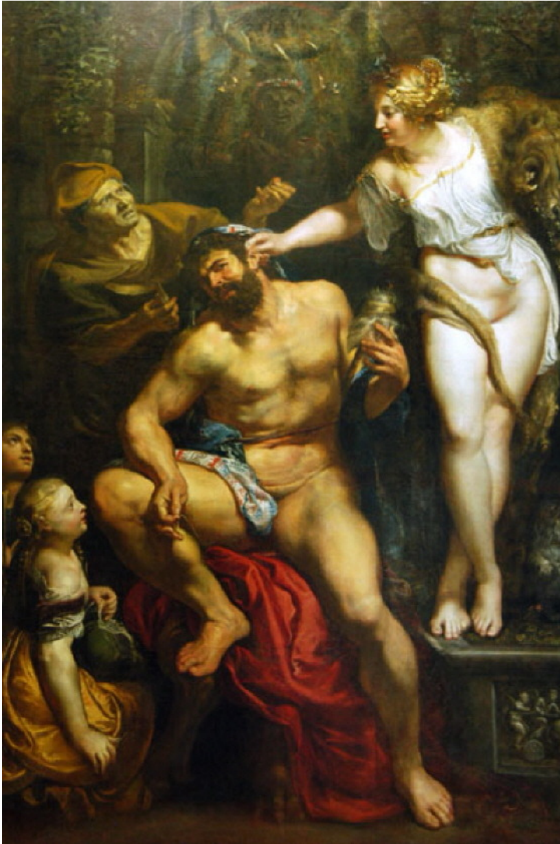
Pieter Paul Rubens, Hercules en Omphale (1602-05)