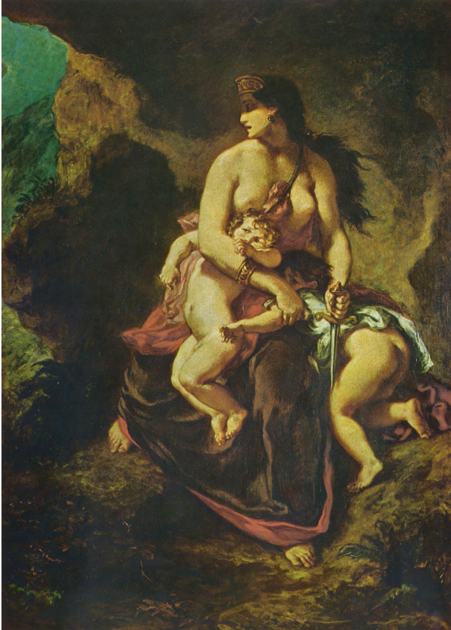
Eugène Delacroix, Medea (1838)

Medea vluchtte eerst naar Thebe bij Herakles. Hij had haar bescherming beloofd, mocht Jason haar ooit ontrouw zijn. Herakles hield woord 'en zij genas hem van de waanzin als gevolg waarvan hij zijn kinderen had vermoord.' 68 De Thebanen wilden de moordenaress van hun koning Kreon en hun prinses Glauke geen asiel geven. Dat kreeg ze van de koning van Athene, Aegeus. Hij trad met haar in het huwelijk en ze kregen een zoon, Medos. Toen Aegeus zijn verloren zoon, eigenlijk een zoon van Poseidon, terug kwam bij zijn vader, beseftte Medea dat haar zoon Medon geen kans meer maakte op de troon van Athene. Medea probeerde Theseus te vergiftigen, maar dat mislukte. Ze vluchtte en keerde terug naar Azië. Perses, haar oom had haar vader in Kolchis van de troon gestoten. Ze ging terug naar Kolchis, doodde Perses en zette Aietes terug op de troon.