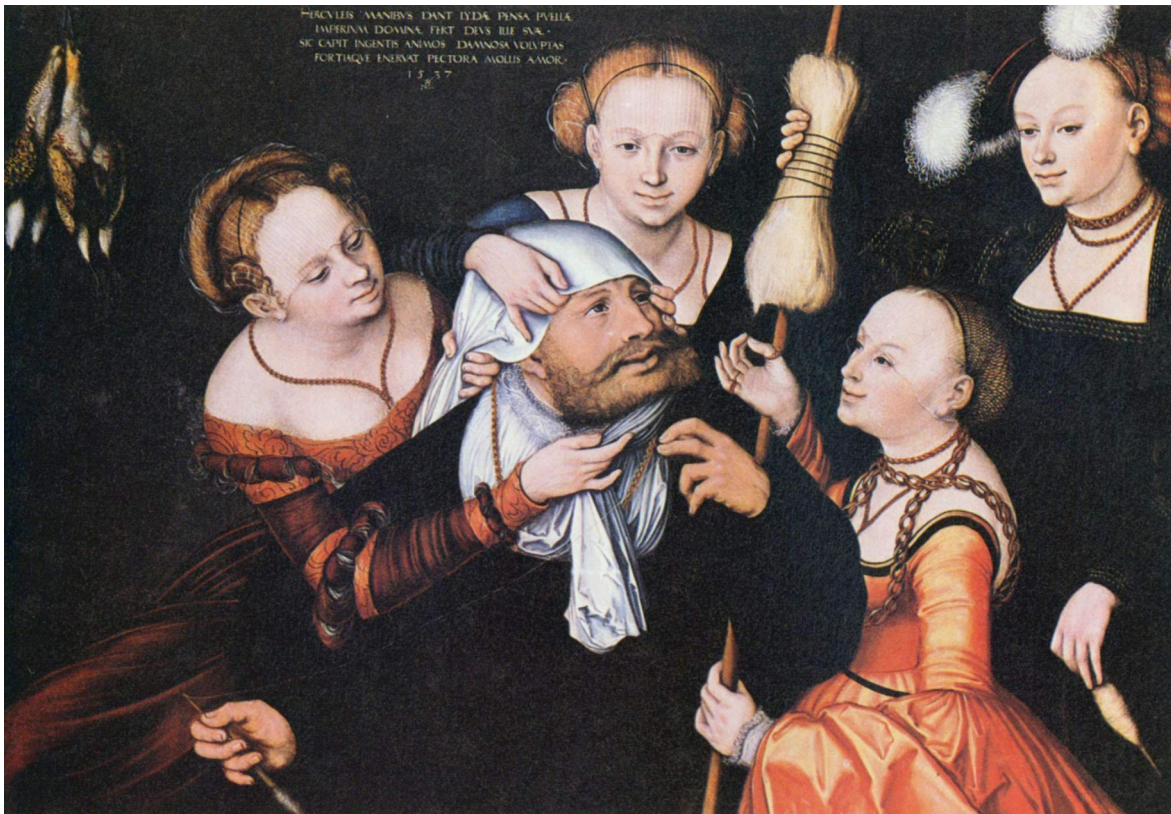
Lucas Cranach, Herakles en Omphale (1537)

De symboliek van de liefde, meestal gesymboliseerd door de blinde Cupido's, vinden we op het schilderij van Lucas Cranach (1472-1553) in een andere vorm; de twee dode patrijzen in de linker bovenhoek symboliseren de overwinning van Amor op de krachtpatser Herakles. 31 Vrouwen van verschillende leeftijden doen hem vrouwenkleden aan en stoppen hem materiaal om te spinnen in zijn handen. Herakles kijkt, met extatische blik, naar Omphale. Op dit middeleeuwse schilderij draagt Omphale de symbolen van Herakles' kracht, de knuppel en de leeuwenhuid, niet. Zij leidt de verkleedpartij van haar slaaf.