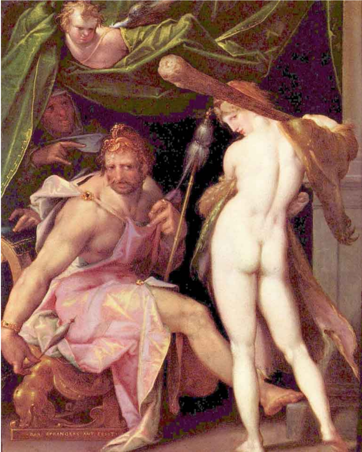
Bartholmæus Spranger, Herakles en Omphale (1585)