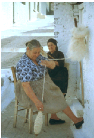
Vrouw met spinrok en spintol, Griekenland