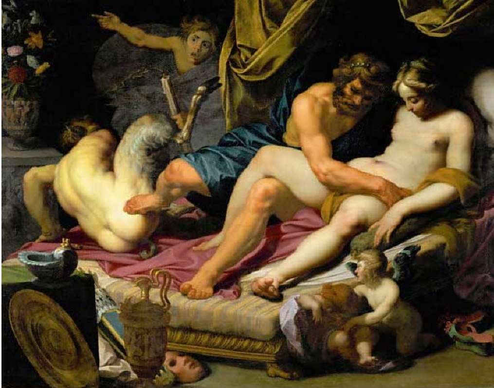
Abraham Janssens, Herakles schopt Pan uit bed (1607)

Rubens zijn schilderij focust zich op de 'meesteres - slaaf' verhouding. Omphale houdt Herakles aan zijn oor op zijn plaats. Zij heeft zijn leeuwenhuid al in bezit genomen. Hij heeft de instrumenten van zijn slavernij al in zijn handen; instrumenten om te spinnen. Spinnen en weven zijn al eeuwenlang een symbool voor seks. De spinrok, die Herakles in zijn hand heeft, is een symbool voor het vrouwelijke geslacht, de spil of spintol, ook wel konkel genoemd, dit staat voor de penis, spinnen voor copuleren, 'naaien'. 30