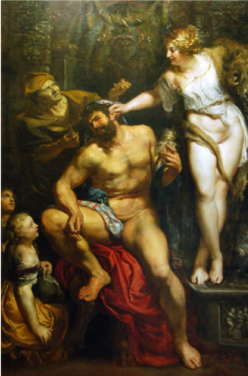
Pieter Paul Rubens, Hercules en Omphale (1602-05)

Plato legt deze woorden in de mond van Socrates: 'Wanneer nu de voerman, bij het aanschouwen van de liefdewekkende verschijning, door die waarneming zijn ganse ziel doorwarmd heeft, en stilaan vervuld raakt van de kitteling en de aanprikkelingen van het liefdesverlangen, dan ziet men hoe het paard, dat zijn menner gehoorzaamt en dat ook nu weer, zoals altijd, door schaamtegevoel beheerst wordt, zichzelf bedwingt om niet op de beminde los te springen; de andere stoort zich echter niet langer aan de sporen of de zweep van de menner, het springt met geweld vooruit, het bezorgt alle mogelijke last aan zijn jukgenoot en aan de voerman, en dwingt hen de lieveling te naderen en hem de streling der minnelusten indachtig te maken.' 21