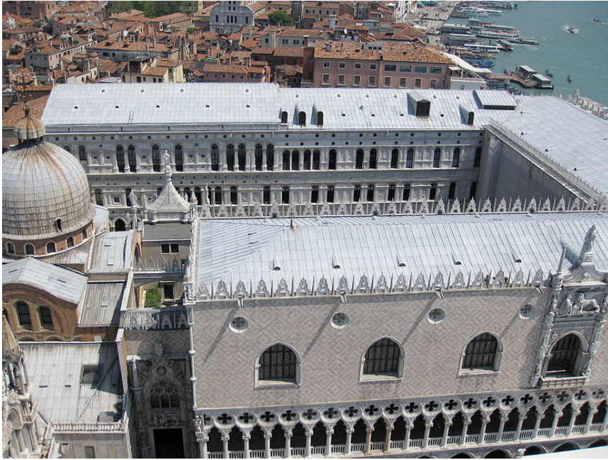
Piombi; loden dak op Dogepaleis in Venetië