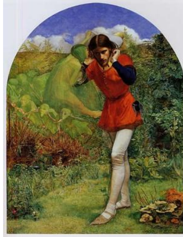
schilderij van John Everett Millais: Ariel lokt Ferdinand