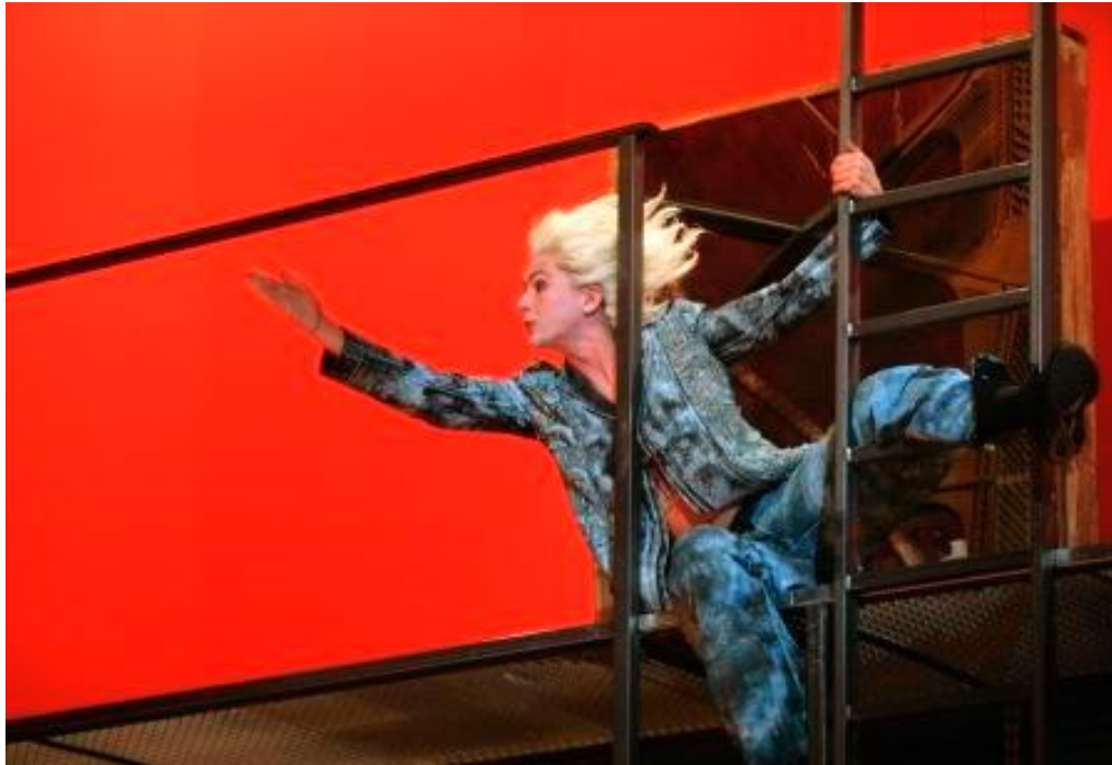
Ariel (Toneelgroep De Appel)

Opdracht 5: Zowel Kalibaan als Ariel moeten doen wat Prospero hen beveelt. Toch gaat Prospero totaal anders om met Ariel dan met Kalibaan. Leg uit waarom dat zo is.