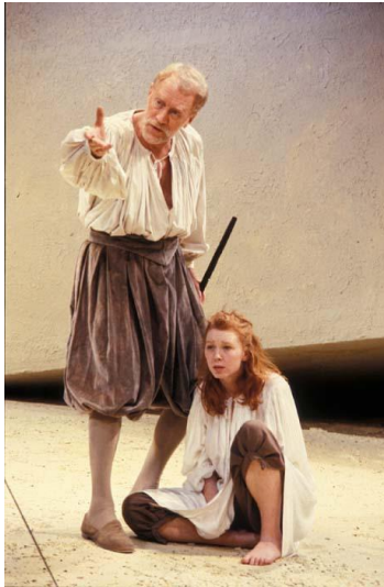
Max von Sydow

b. Vind je Prospero een goede vader voor Miranda? Leg uit waarom wel waarom niet.