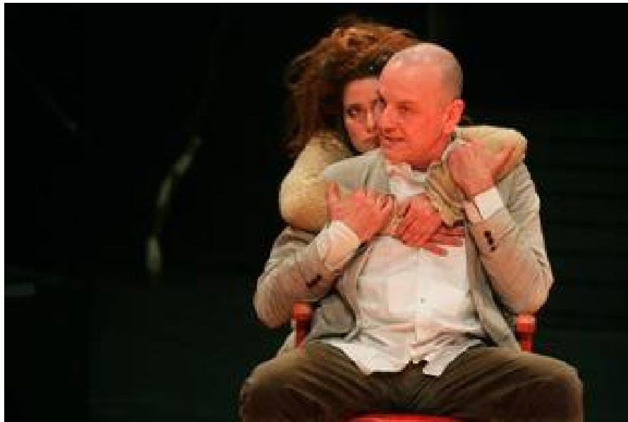
Prospero en Miranda in de voorstelling van De Appel