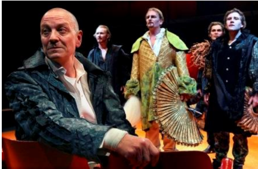
Prospero en leden van de gestrande hofhouding (Toneelgroep De Appel)