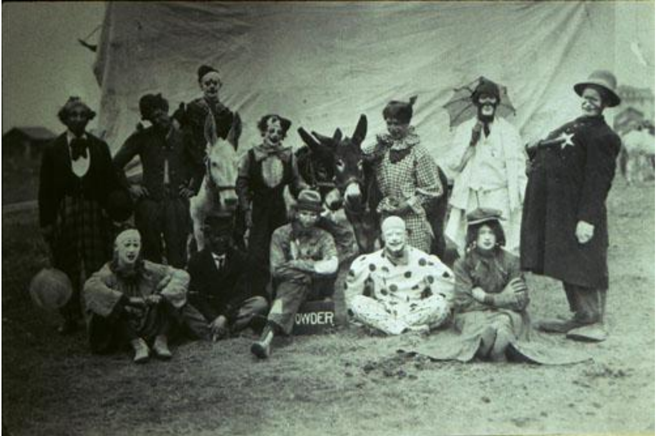
clowns 1900 in Amerika